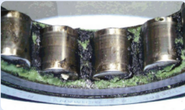
Verschmutzter Schmierstoff durch Funkenerosion